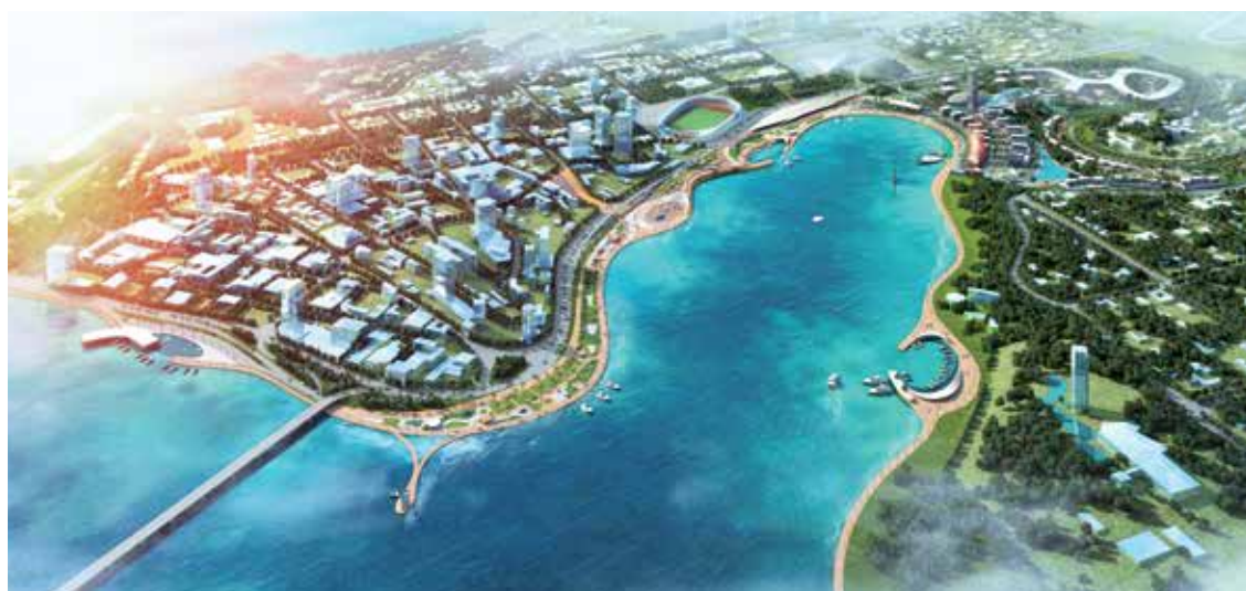
Projet d'Aménagement de la Baie de Cocody