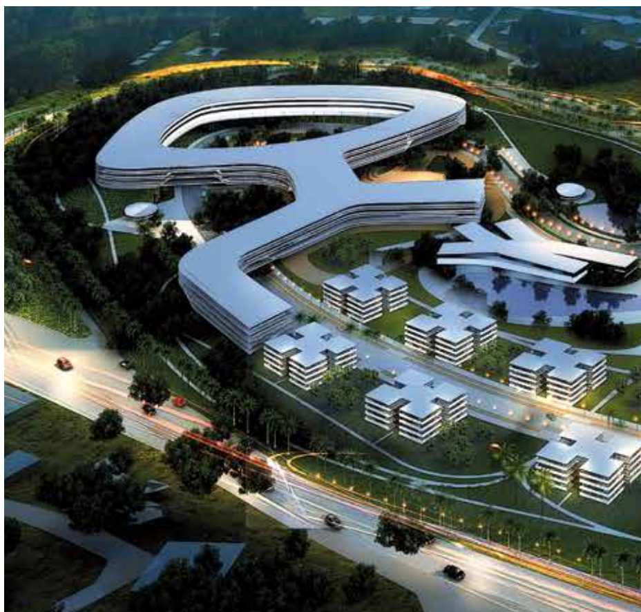
Projet d'Aménagement de la Baie de Cocody