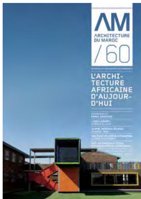
Nouvelle maquette réalisée par Nina Pilon pour Integral Philippe Délis